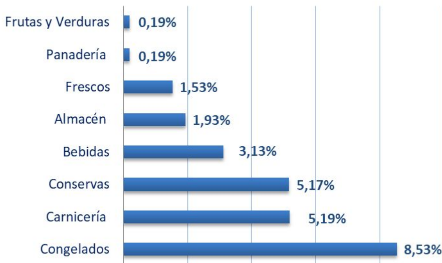
Variación (%) por Rubros Diciembre/Noviembre 2018

Examinando la variación de precios por PRODUCTO , para el mes de diciembre en relación a los precios de noviembre de 2018 se observó que el ítem que tuvo mayor incremento intermensual fue el “Zapallo ancó” con 9,73% , seguido por “Manteca Premio” 9,26% , “Zanahoria” 8,80% y “Queso cuartirolo Cremoso/Por salut - La Serenísima” 8,61% .